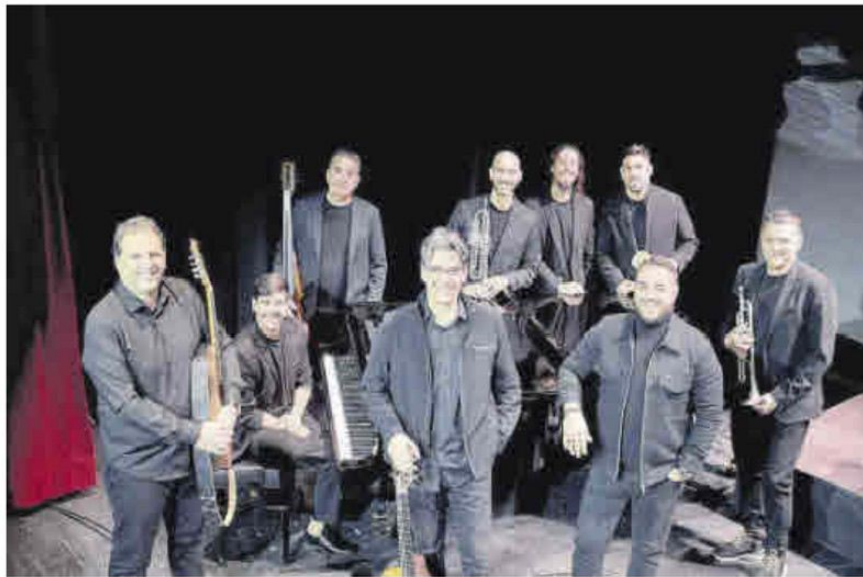
Los miembros de la agrupación palmera Troveros de Asieta.