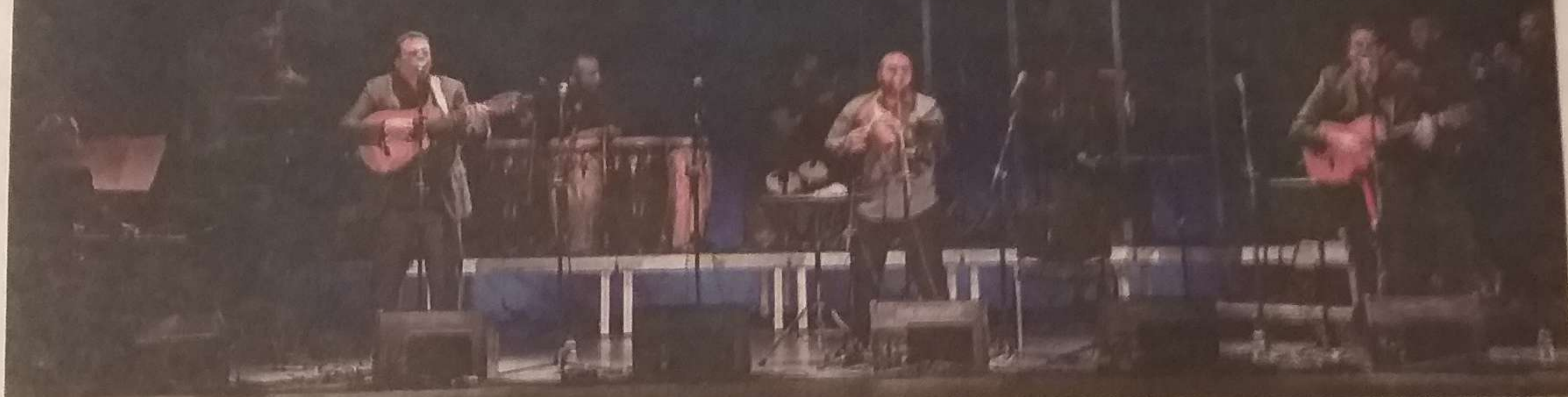
El grupo, con una formación de nueve músicos, ofrecerá temas creados en 2018, además de títulos emblemáticos.